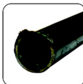
Antes de procesar

Cortadores especialmente desarrollados para realizar procesos de calidad y largos periodos de trabajo