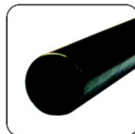
Después de procesar